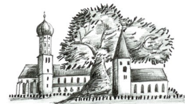
Dorfverein Mönchsdeggingen e. V.

In Mönchsdeggingen steht der erste Artenschutzurm im Ries Dorfverein übergibt den Turm seiner Bestimmung